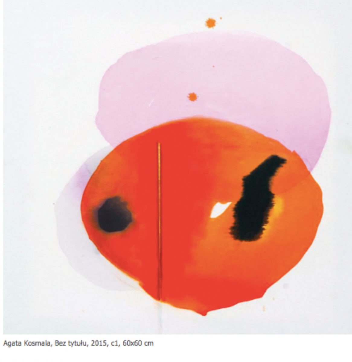
Agata Kosmala, Bez tytułu, 2015, c1, 60x60 cm

Wystawa potrwa od 29 sierpnia do 19 września 2015 roku Miejsce: Nowa Gazownia, ul. Ewangelicka 1